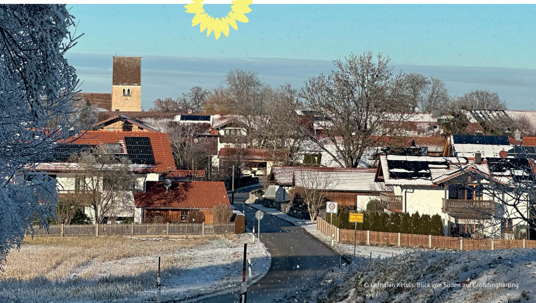
© Christian Ketels: Blick von Süden auf Großdingharting